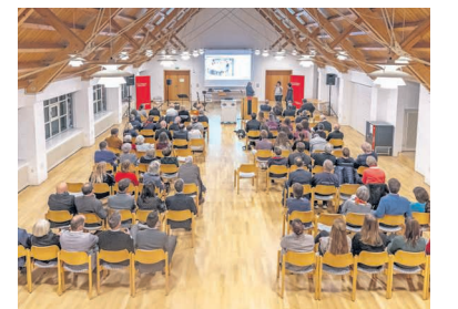
Die Preisverleihung fand im Henninger Saal der KSK statt.

Tauchgruppe Teck Damit sich bei geschlossenen Bädern der Verein nicht automatisch auflöst, haben die Mitglieder ein Programm fürs „Trockentauchen“ auf die Beine und die Theorie in den Mittelpunkt gestellt.