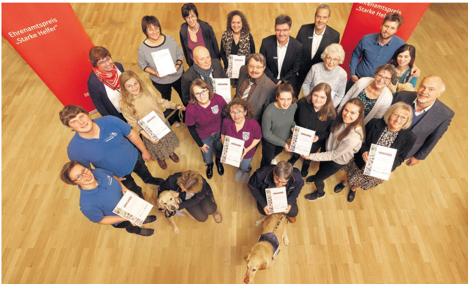
Die strahlenden Sieger des Ehrenamtspreises bei der feierlichen Preisübergabe im Henninger Saal der Kreissparkasse.

als ein absolutes Besuchsverbot in diesen Einrichtungen herrschte. Auf diese Art konnte auf Abstand der Kontakt mit der Außenwelt für die Heimbewohnerinnen und -bewohner wenigstens ein bisschen aufrechterhalten werden.